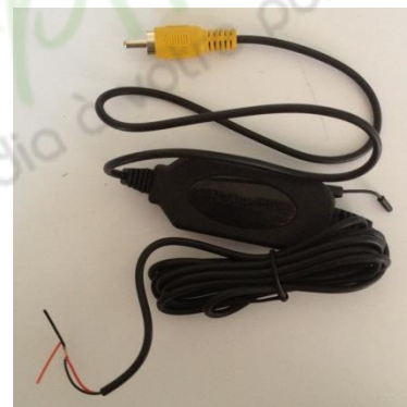
Récepteur sans fil