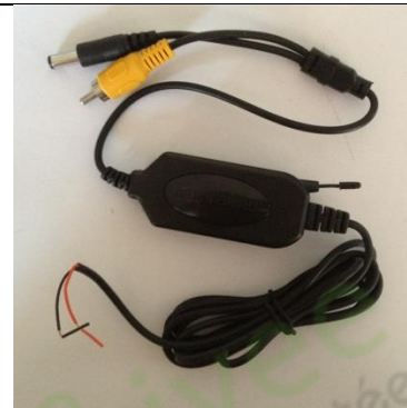
Emetteur sans fil