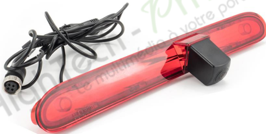
Caméra de recul avec feu Stop (Différente selon modèle)