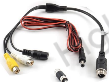
Alimentation + Vidéo